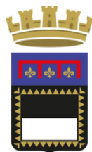
Comune di Cesena