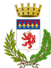
Comune di Faenza