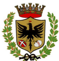
Comune di Forlì